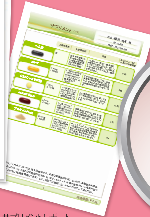
サプリメントレポート

健康診断と同じ血液検査項目でも、 オーソモレキュラー栄養医学に基づいて見ると、 あなたの不調の原因が見えてきます。